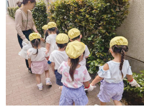
地域に愛着をもち、社会参画をする経験