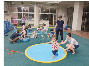
<未就園児の会> 未就園児に対する活動、遊び場や交流の場の提供など、子育ての相談機能の役割を果たす

発信のポイント：幼児教育施設（ヨコ）と小学校（タテ）、地域をつなぐ結節点としての役割を意識しよう