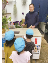
地域へ出掛け、地域の人と関わる経験