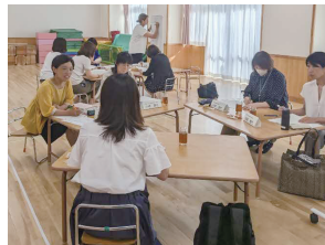
<幼保小合同研修会> 幼稚園、保育所、小学校の連携カリキュラムの作成などを推進する