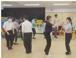
<合同研究会、合同研修会> 公開保育や研究などを行い、都国公立園が地域の結節点として幼児教育の質の向上に貢献する