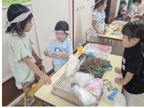
地域での共通の体験を生かし、遊びが豊かになる経験